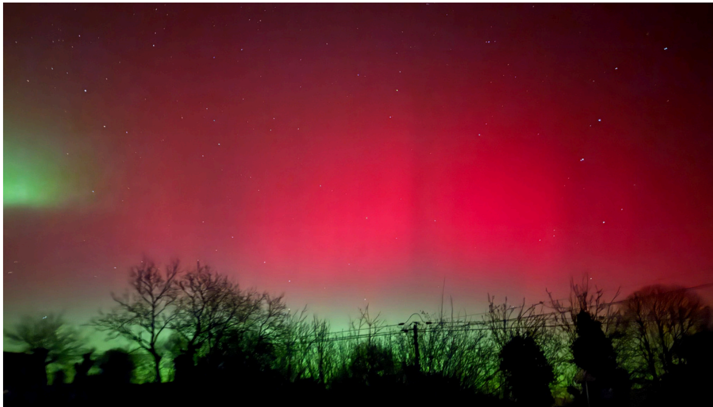
Aurore boréale à Coatréven le 19 janvier 2026

Bulletin d'information de la commune Lizher kelaouiñ ar gumun