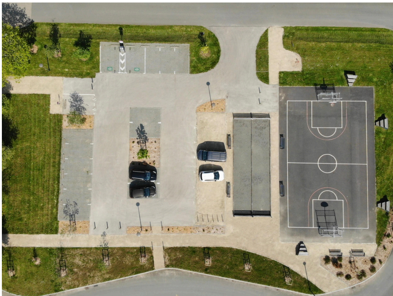
Place des Bosquets - Vue de drone (lundi 28 avril 2025)

Bulletin d'information de la commune Lizher kelaouiñ ar gumun